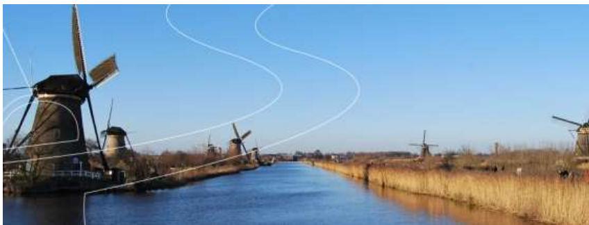
Oproep Molenlanden 2019