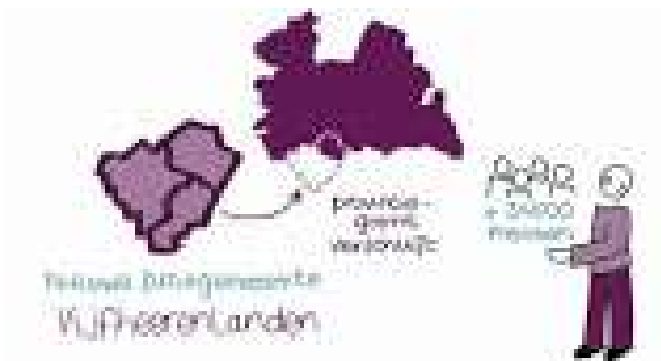
Oproep Vijfheerenlanden 2019

En ook nu hebben we jullie nodig. Wat gold in 2002 geldt nog steeds in 2019