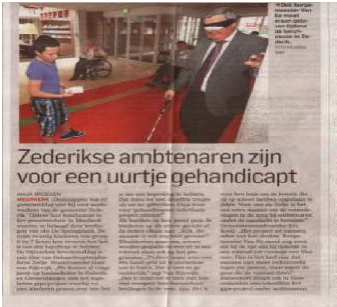
En de burgemeester weet nu ook wat het betekent als je een beperking hebt

Uiteindelijk stelden ze vast dat zijn bewegingsvrijheid toch wel uiterst beperkt werd toen hij zich schoorvoetend een weg door het gebouw baande.