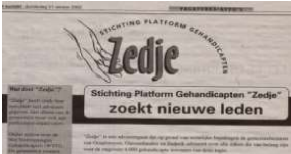
Oproep Zedje in 2002

Uiteraard wens ik de nieuw te vormen adviesraden een goede start toe en ik ga ervan uit dat ze alles uit de kast zullen halen om op te komen voor de belangen van mensen met een beperking.